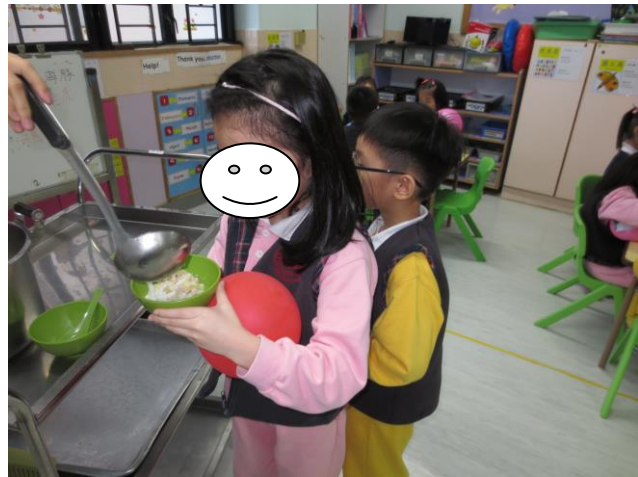
幼兒取食物時也不忙照顧自己的汽球寶寶