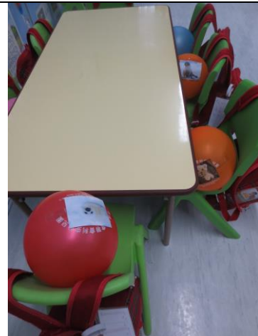
幼兒排洗時將汽球寶寶謹慎地放於椅子上