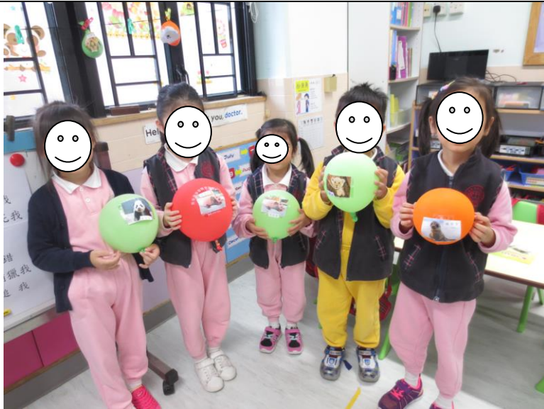
假期過後，幼兒已完成父母的責任，將汽球寶寶交回學校，並互相分享經驗